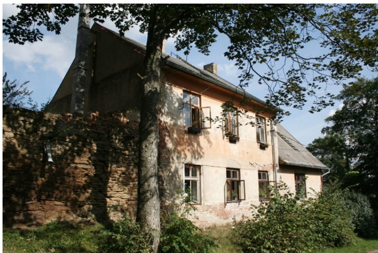
Sídlo Českého západu o.s.